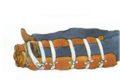
Spjelking av leggen