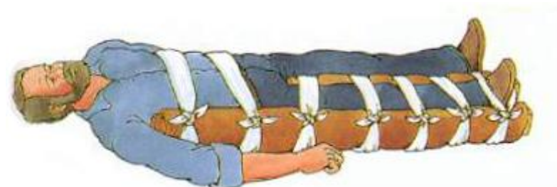
Spjelking av låret