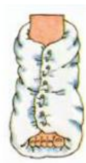
spjelking av ankel