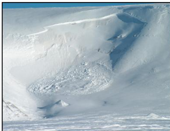
(Bilde av et tørt flakskred!)

« ... snøskreda har eldre heimstadrett her i landet enn folket som har vore plaga av dei til alle tider ... »