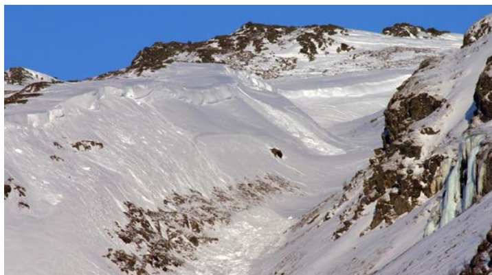
Sprænbekken i Oppdal